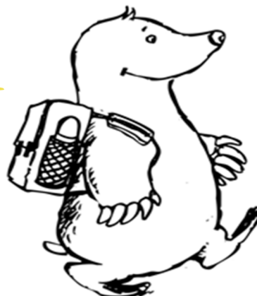
Die Maulwürfe Frankenstraße 1